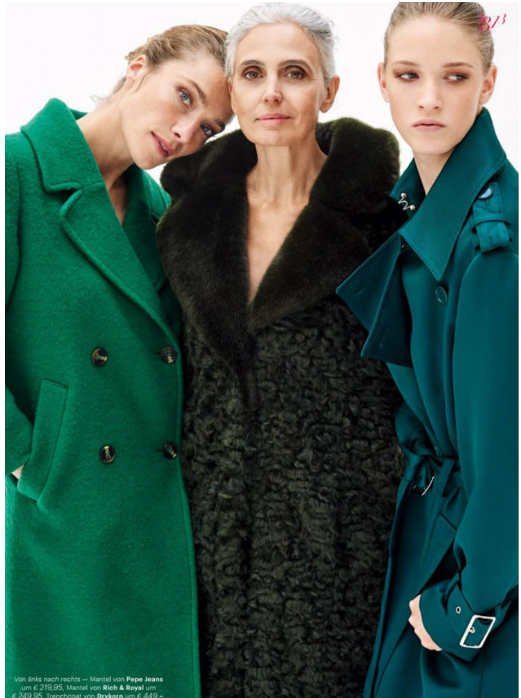
Von links nach rechts — Mantel von Pepe Jeans um € 219,95, Mantel von Rich & Royal um € 249,95, Trenchcoat von Drykorn um € 449,-